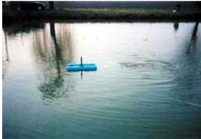
Lassú vízmozgatás, áramlás