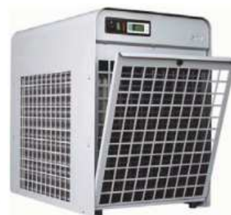
Model TR 30