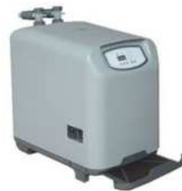
Model TR 15